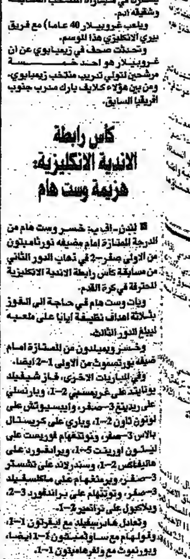
مارتينا ويست هام